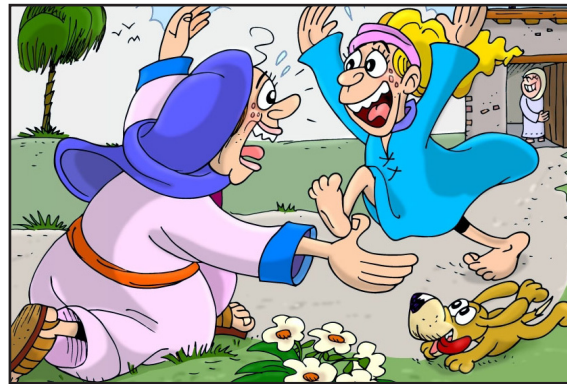
2 La niña sanada

Entonces respondiendo Jesús, dijo: «Oh mujer, grande es tu fe; hágase contigo como quieres.» Y su hija fue sanada desde aquella hora. Mateo 15:28