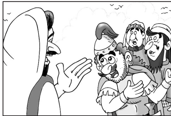
2 «Ve, y como creíste, te sea hecho.»

Entonces Jesús dijo al centurión: «Ve, y como creíste, te sea hecho.» Y su criado fue sanado en aquella misma hora. Mateo 8:13