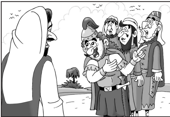
1 El centurión pide a Jesús por su siervo