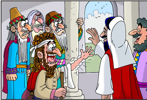
1 Jesús sana la mano del hombre

Mateo 12:9-14; Marcos 3:1-6; Lucas 6:6-10 | Marcos 3:5b