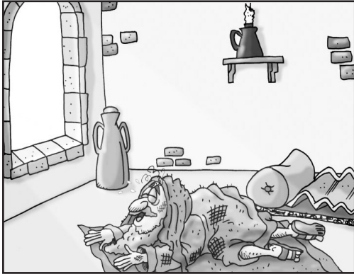
1. Daniel ora, vestido de luto