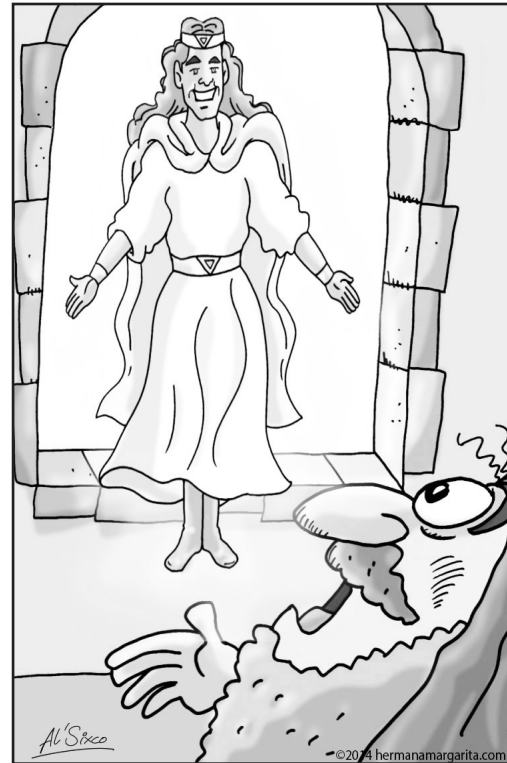
2. El ángel Gabriel y Daniel