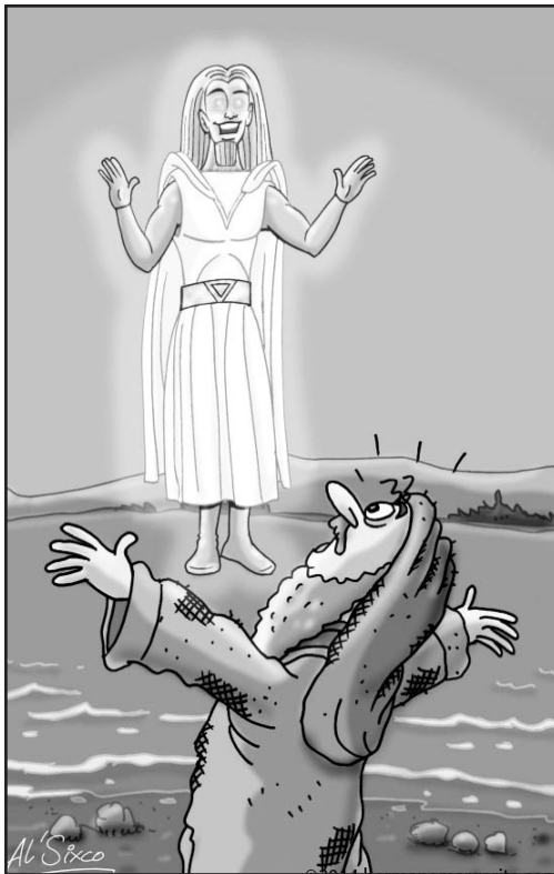
3. Daniel a la orilla del río Tigris y el varón vestido de lino