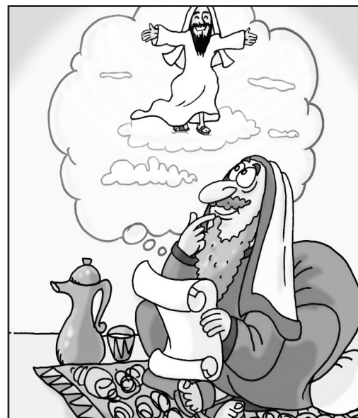
4. Daniel piensa en la venida de Cristo